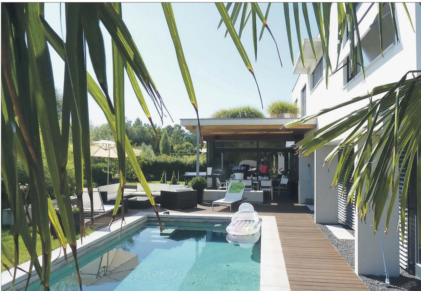
Gehobene Wohnungsarchitektur gehört zu den Markenzeichen des Unternehmens.

Zweckbauarchitektur als zweites Standbein / Firmengründer zieht sich 1975 zurück