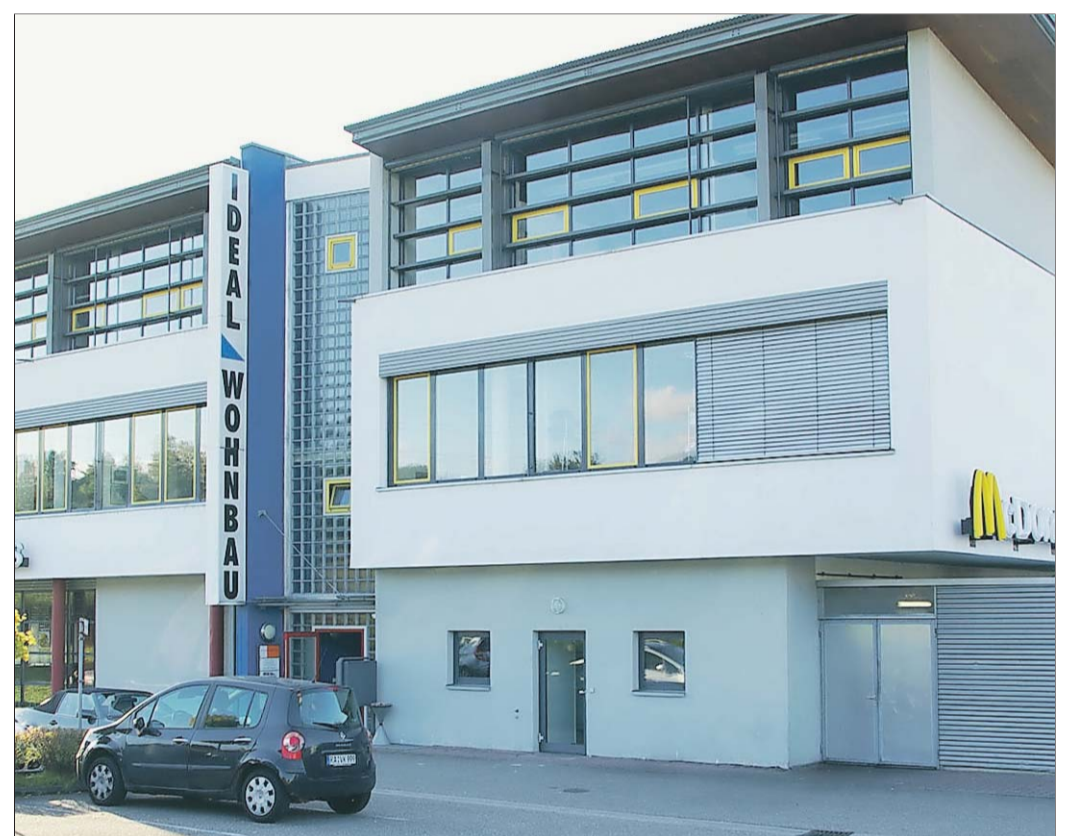
Markant ist der Firmensitz des Unternehmens in Sinzheim.

Kurz nach dem Zweiten Weltkrieg, der große Baulücken in den Städten der Region hinterlassen hatte, war der Bedarf an Wohnungen groß. Auch der Wunsch nach den eigenen vier Wänden erstarkte wieder zunehmend in der Wirtschaftswunderzeit der 1950er Jahre.